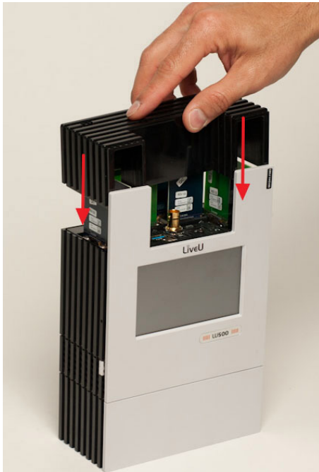
7. ábra: az LU500 felső borításának visszahelyezése