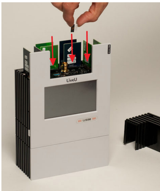
6. ábra: a micro SIM kártyák behelyezése – 2