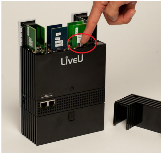
5. ábra: micro SIM kártya behelyezése

A kártyák helyükre érkezését halk kattanó hang kíséri.