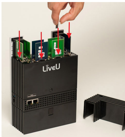
3. ábra: a micro SIM kártyák behelyezése – 1