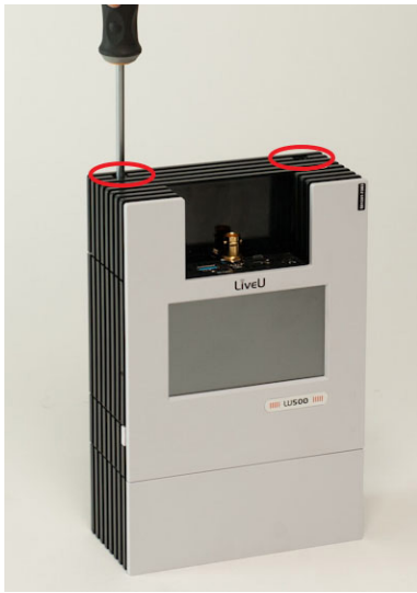
1. ábra: a felső borítás kicsavarozása