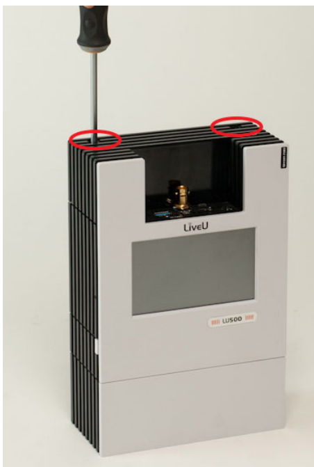
8. ábra: a felső borítás rácsavarozása